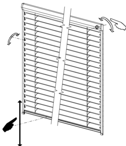
ovládání dostupné žaluzie